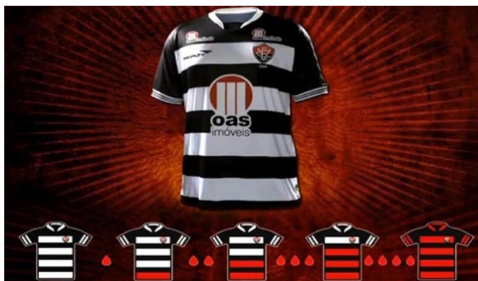
Un club de foot brésilien retrouve le couleur rouge de son maillot grâce aux dons de sang de ses supporters.

C'est ainsi que le foot peut être utilisé pour faire passer des messages, comme notamment le don du sang. C'est en tout cas l'excellente idée qu'à eu le club de foot d'EC Vitória, en partenariat avec la Banque de sang de l'Etat de Bahia Hemoba. Le club brésilien a supprimé les bandes rouges symboliques du maillot officiel de ses joueurs. Pour redonner du rouge au maillot de l'équipe, le club devait défier ses fans en les incitant à faire un don de sang. A chaque pro-