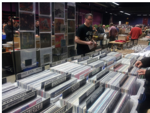
80 exposants de France et d'Europe seront présents à la Trocardière