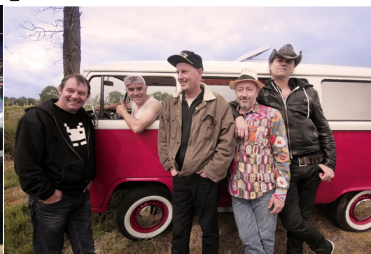
Le groupe Elmer Food Beat en show-case et dédicaces le samedi.

Le salon du disque est le lieu de rencontre entre disquaires, mélomanes et collectionneurs. Il y en a pour tous les goûts : yé-yés, pop-rock, métal, reggae, R'n B... Et toutes les bourses, des albums soldés aux disques d'or, en passant par les disques neufs et d'occasion. Tous les formats y sont re-