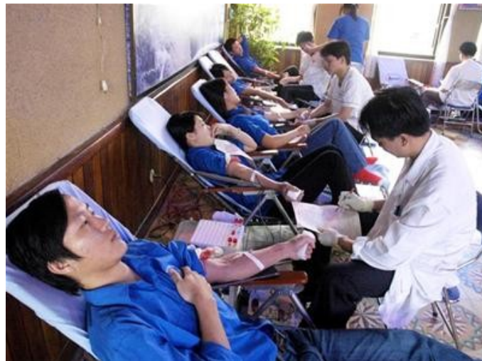
Au Viet Nam, les dons de sang volontaires représentent aujourd'hui 90% de l'approvisionnement total.

Par ailleurs, chaque année dans le monde, les accidents de la route font 1,3 millions de morts et 50 millions de blessés ou d'handicapés. 90% des décès consécutifs à un accident de la route surviennent dans les pays en développement. Les hémorragies non contrôlées entraînent