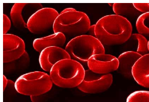
La culture des globules rouges ne peut encore remplacer le sang des donneurs.

A l'avenir, cette découverte ne répondra qu'à certains besoins : ceux des polytransfusés et des malades dotés de groupes sanguins rares. Ces deux « populations » de patients ne représentent qu'à peine 3% des besoins actuels, ce qui correspond à