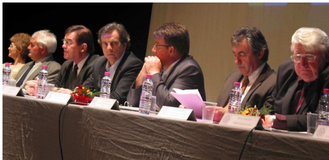
Le Congrès départemental de l'UD 44 s'est tenu cette année à Ligné.

Les taux d'ajournements des donneurs de sang total est en légère augmentation (9,6 % en 2004; 9,3 % en 2005 et 9,9 % en 2006). Pourtant, le nom-